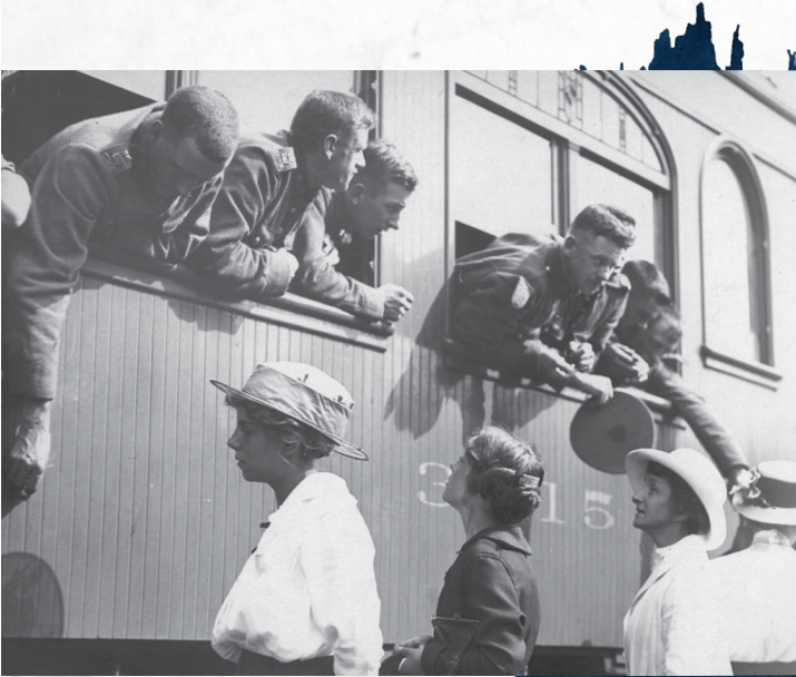
Les soldats partent pour la guerre, gare d'Union.