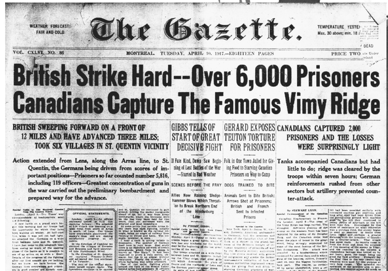
Montreal Gazette , 10 avril 1917 (avec la permission du Toronto Star Newspaper Centre/Toronto Reference Library).

PROLONGEMENT : Pour plus de renseignements, jetez un coup d'œil aux articles Journaux , Loi sur les mesures de guerre et Censure sur le site de L'Encyclopédie canadienne .