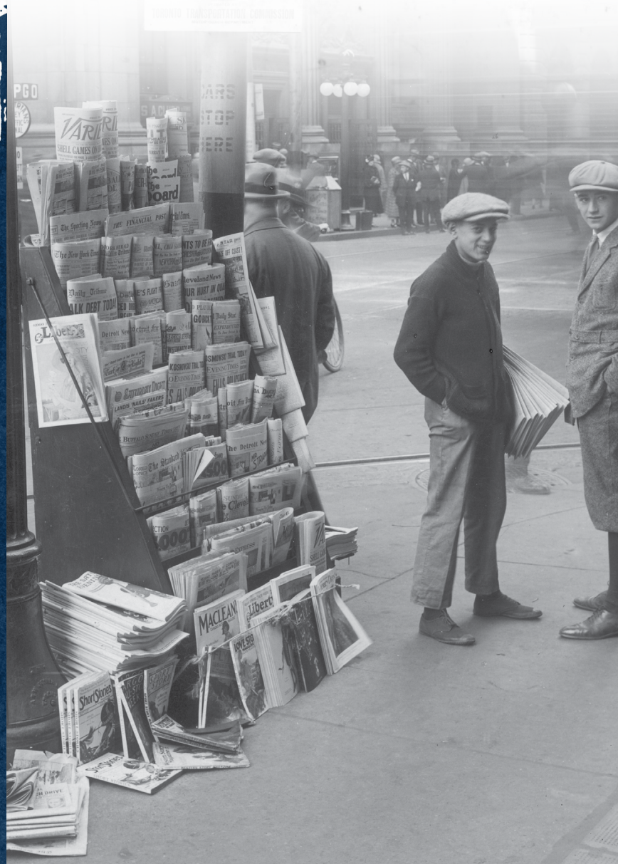
Vendeurs de journaux au travail, Toronto, au coin de rue King et rue Yonge.