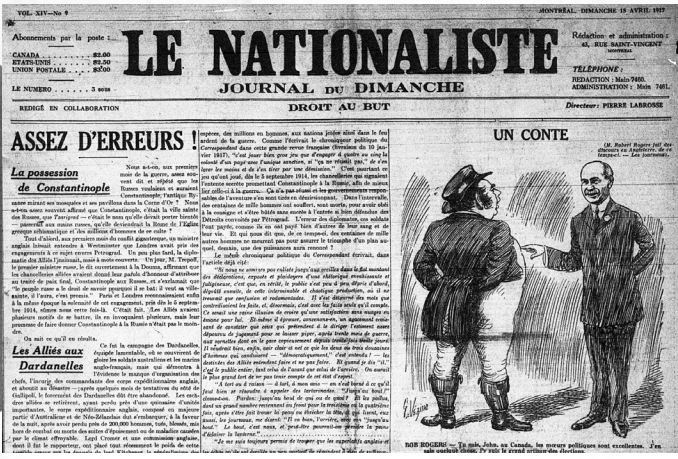
Le Nationaliste, 15 avril 1917 (avec la permission du Media Commons/Robarts Library/Université de Toronto).

MODIFICATION : Ayez une discussion de classe au sujet de la façon dont les médias sociaux ont perturbé le reportage de nouvelles. Nous pouvons auparavant nous fier aux journalistes professionnels des journaux nationaux pour rapporter les nouvelles. Maintenant, comme résultat de l'existence des médias sociaux et de notre connectivité avec Internet, nous sommes tous des journalistes. Selon vous, quelle est la source primaire la plus fiable : un journal national quotidien majeur, ou une personne qui est dans la rue pour capturer les événements alors qu'ils se produisent? N'oubliez pas que les deux perspectives peuvent être influencées par des penchants politiques dont nous n'avons pas conscience.