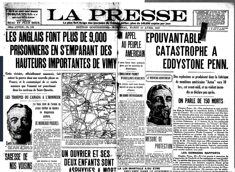
La Presse , 10 avril 1917 (avec la permission du Media Commons/Robarts Library/ Université de Toronto).