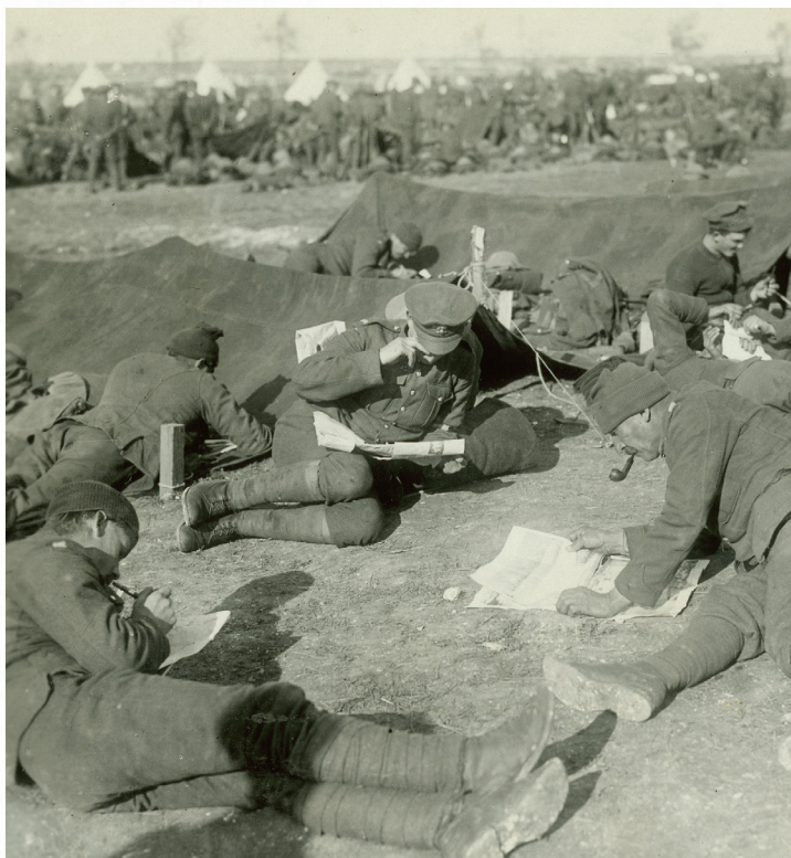
Journal du pays.

Ces feuilles de travail accompagnent la vidéo Pensez comme un historien : Vimy dans les journaux , qui explore les comptes rendus de deux journaux, Le Canada et The Globe , dans les jours suivant la bataille de la crête de Vimy. Afin de souligner le centenaire de la bataille de la crête de Vimy et d'aider les éducateurs et les élèves à analyser les sources primaires de façon critique, Historica Canada a créé la série de vidéos et de feuilles de travail Pensez comme un historien . La série Pensez comme un historien a été produite avec le généreux soutien du gouvernement du Canada. Historica Canada est le plus grand organisme du pays dédié à l'augmentation de la connaissance de l'histoire et de la citoyenneté canadiennes.