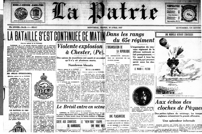
La Patrie, 10 avril 1917.