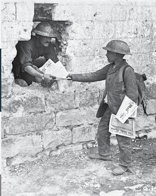
Un petit vendeur de journaux français vendant des journaux anglais dans la ligne canadienne, juin 1917.

QUESTION DIRECTRICE : Qu'est-ce que les comptes rendus du Le Canada et The Globe révèlent au sujet de la bataille de la crête de Vimy?