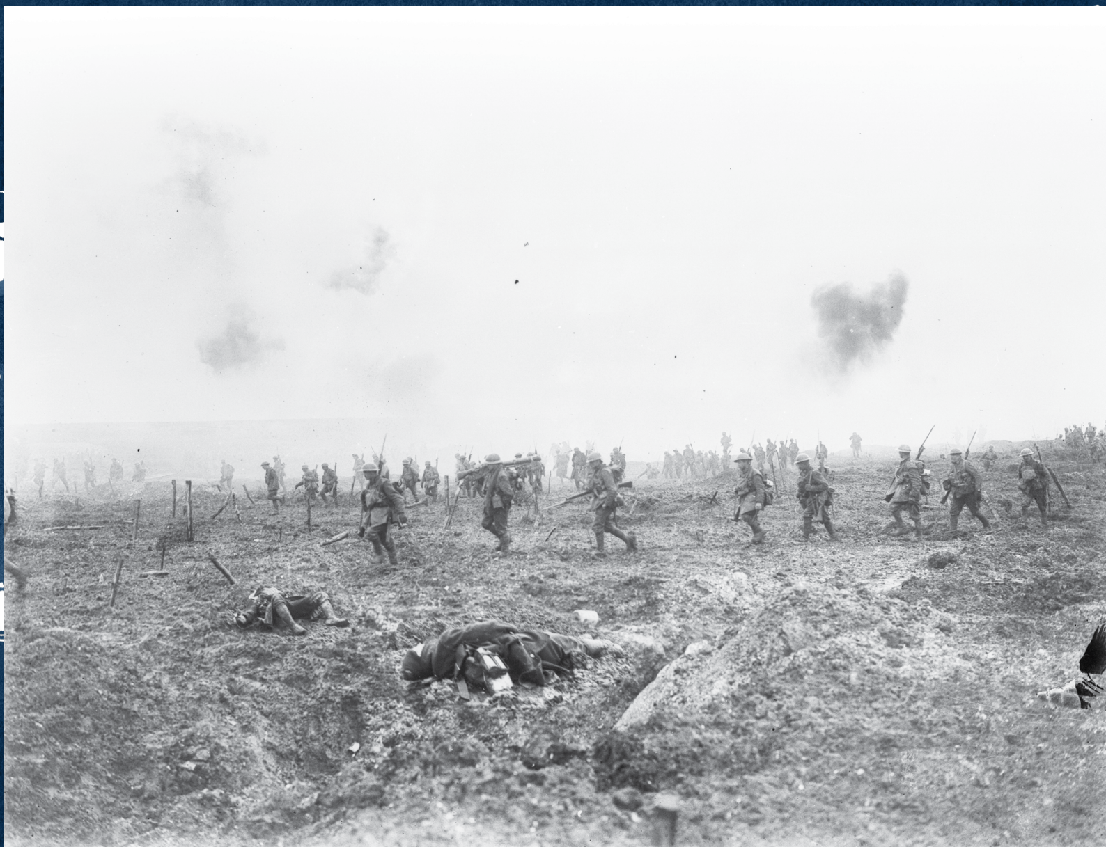
Progression du 29 e Bataillon d'infanterie dans le « No Man's Land » à travers les fils barbelés et sous un tir nourri pendant la bataille de la crête de Vimy (avec la permission de Bibliothèque et Archives Canada/W.I. Castle/PA-001020).