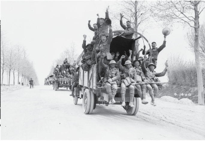
Les gars de Byng (les « Byng Boys ») revenant de la crête de Vimy.

MODIFICATION : En travaillant en paires, comparez les deux images (ci-dessous). Créez un tableau en T et faites une liste de mots descriptifs pour chaque image. Comparez vos deux listes. Qu'y a-t-il de similaire et qu'y a-t-il de différent? Ces images racontent-elles la même histoire de la bataille de la crête de Vimy?