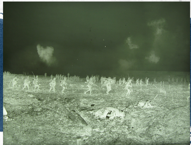
Négatif sur plaque de verre de la photographie. Progression du 29 e Bataillon d'infanterie dans le « No Man's Land » à travers les fils barbelés et sous un tir nourri pendant la bataille de la crête de Vimy.