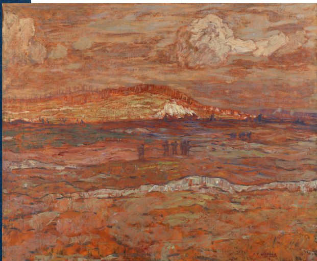
« Le Pimple le soir » d'Alexander Young Jackson, mars 1918. Des soldats progressent les uns derrière les autres vers le Pimple, une position au nord de la crête de Vimy. Jackson fut membre fondateur du Groupe des Sept.