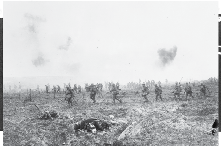
Progression du 29 e Bataillon d'infanterie dans le « No Man's Land » à travers les fils barbelés et sous un tir nourri pendant la bataille de la crête de Vimy (avec la permission de Bibliothèque et Archives Canada/W.I. Castle/PA-001020).