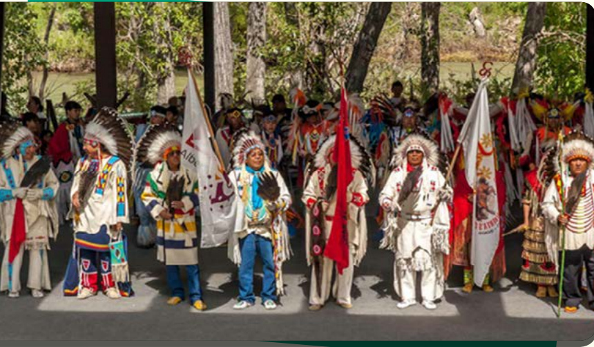
▲ Des aînés des Pieds-Noirs inaugurant le village autochtone traditionnel lors du Stampede de Calgary, en Alberta. Une cérémonie pied-noir a lieu tous les jours. Photo prise le 10 juillet 2005.

Les aînés et les mentors comptent parmi les personnes les plus importantes dans les communautés autochtones. Les gens leur démontrent du respect et écoutent leur sagesse. Les aînés sont souvent des figures spirituelles qui transmettent des leçons aux plus jeunes. Les mentors sont des membres de la communauté qui démontrent des habiletés de leadership mais qui ne sont peut-être pas formellement considérés comme des aînés. Toute personne qui vous sert de modèle peut être considérée comme un mentor.