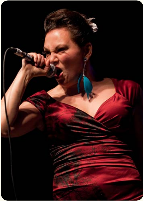
L'interprète de chants de gorge novatrice et primée Tanya Tagaq. ▲

Qu'est-ce qu'une piste? Il peut s'agir d'un chemin à travers une forêt qui traverse votre terre ancestrale. Il peut aussi s'agir d'un parcours entrepris par un peuple autochtone à un certain moment dans son histoire. Il peut plutôt s'agir d'une idée, d'une voie ouverte par une personne modèle ou un dirigeant autochtone afin qu'elle puisse être suivie par les autres par la suite. Pour répondre à cette question, vous pouvez aussi vous questionner afin de savoir ce que ce sujet signifie pour vous et suivre votre propre piste d'écriture afin de créer une histoire originale.