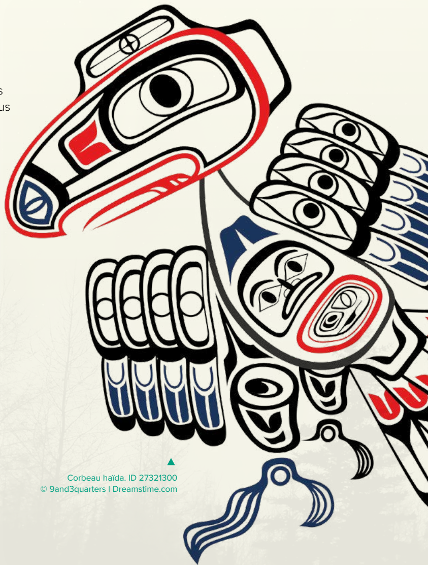
Corbeau haïda. ID 27321300